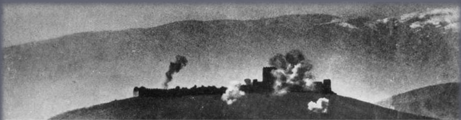
New Zealand positions at Platamon castle under bombardment. Mounts Ossa and Pelion are in the background