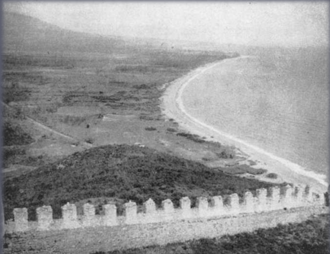
The coastline north of Platamon from the castle. The railway runs to the left