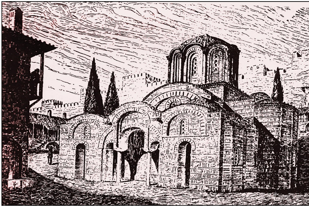
Εικόνα: Αποκατάσταση της αρχικής μορφής του καθολικού της Μονής Βλατάδων (κατά Α. Ξυγγόπουλο).